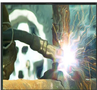
3/X/X/X Zkreslený obraz

Pozn.: EN 379 - Prostředky k ochraně očí - Automatické svařečské filtry