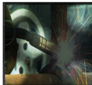
X/X/3/X Nerovnoměrné ztmavení