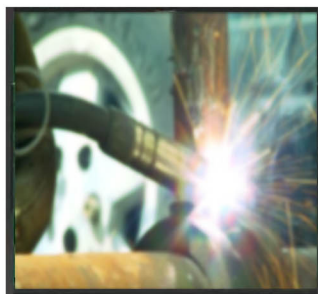
X/3/X/X Rozmazaný obraz